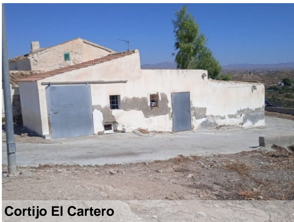
Cortijo El Cartero