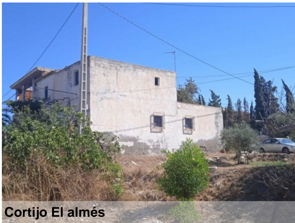
Cortijo El almés