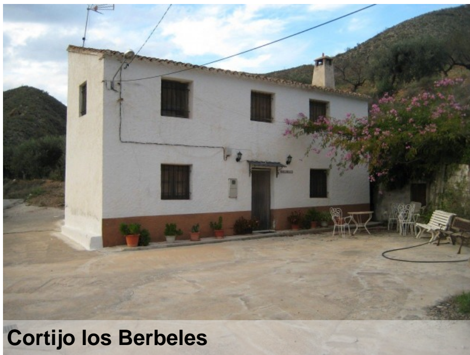
Cortijo los Berbeles