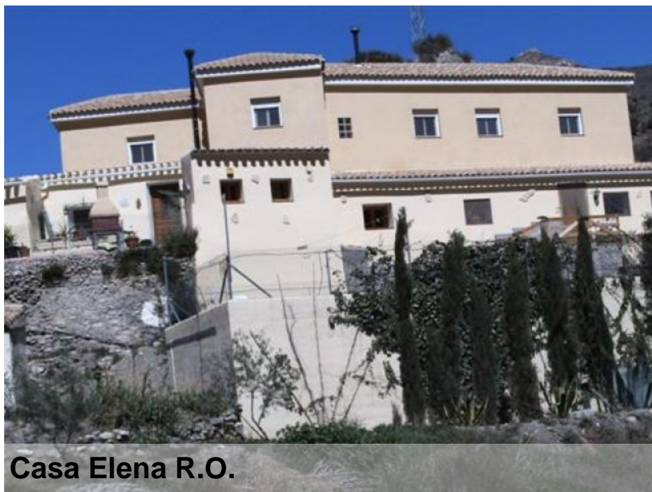
Casa Elena R.O.